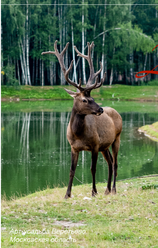
Арт-усадьба Веретьево Московская область